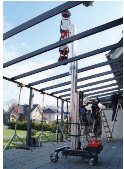
DSKE2 avec chariot WLU KS 5.1