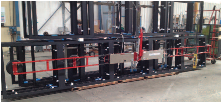
DSKE2 format XXL